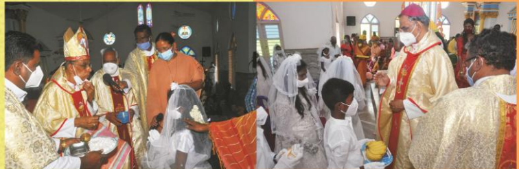
First Holy communion & Confirmation Mass at Mathigiri