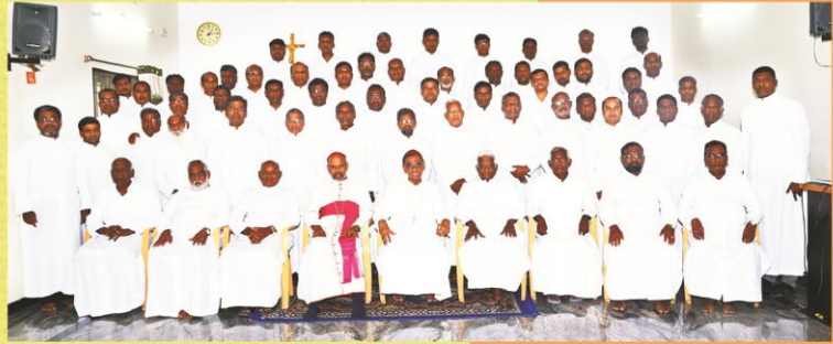
Annual Retreat of Clergy at Sundampatty