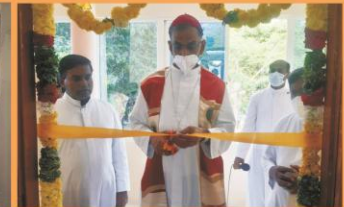
Blessing of the New Rooms at Don Bosco School, Krishnagiri