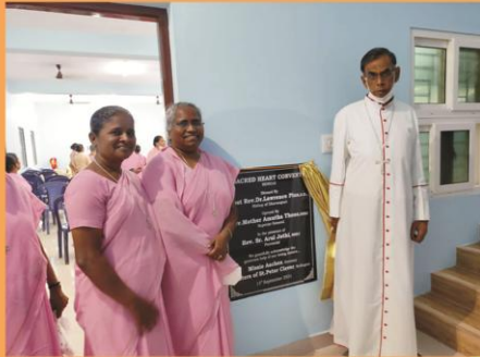
Blessing of the Multi purpose Hall and Residence of SSH congregation at Berigai