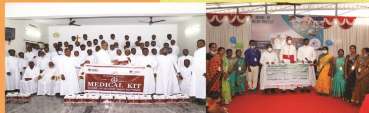
Medical Kit given by Caritas India & Covid Relief given by DSSS