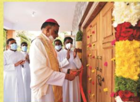
Blessing of the New Community Hall at Sesurajapuram