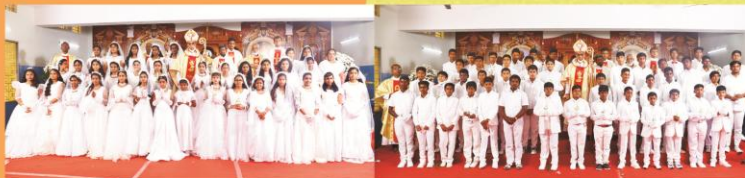
First Holy communion and Confirmation at Krishnagiri